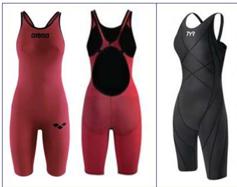
Женский плавательный костюм для соревнований

Отдельный разговор – женский плавательный костюм для соревнований – это продукт высоких технологий. По правилам соревнований с 2010 года женщины-пловцы могут выступать на соревнованиях в комбинезонах-купальниках по колено. Такой костюм оказывает положительное влияние на скорость, осуществляет компрессию мышц, уменьшает сопротивление воды и позволяет спортсмену принять более высокое положение тела на поверхности воды. Плавательные костюмы для соревнований весьма дороги, и понадобятся только спортсменкам, выступающим на соревнованиях.