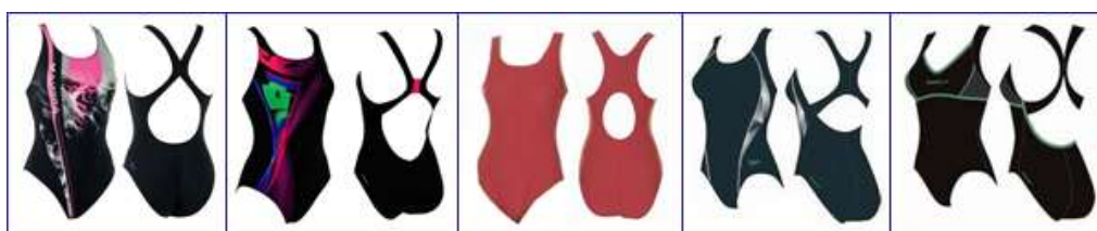
Спортивный купальник для плавания с перекрещивающимися лялками

• купальники с широкими перекрещивающимися на спине лялками или сшитыми на спине в стиле борцовки лялками Такая модель позволяет уверенно и раскованно чувствовать себя в воде и активно тренироваться. Спортивный купальник такой конструкции плотно облегает тело, одновременно позволяя выглядеть очень женственно, подчеркнуть стройность фигуры. Центральный изнаночный шов дает гарантированно хорошую посадку купальника на теле и позволяет свободно перемещаться в воде. Благодаря широким бретелям, купальник не натирает кожу и не врезается в нее. Пересекающие или сшитые на спине бретели обеспечивают полную свободу движений плечами и в области лопаток. Купальник такого типа хорошо поддерживает грудь: чем меньше вырез на спине – тем лучше эта поддержка, в то время как более открытая спина дает дополнительную свободу движений.