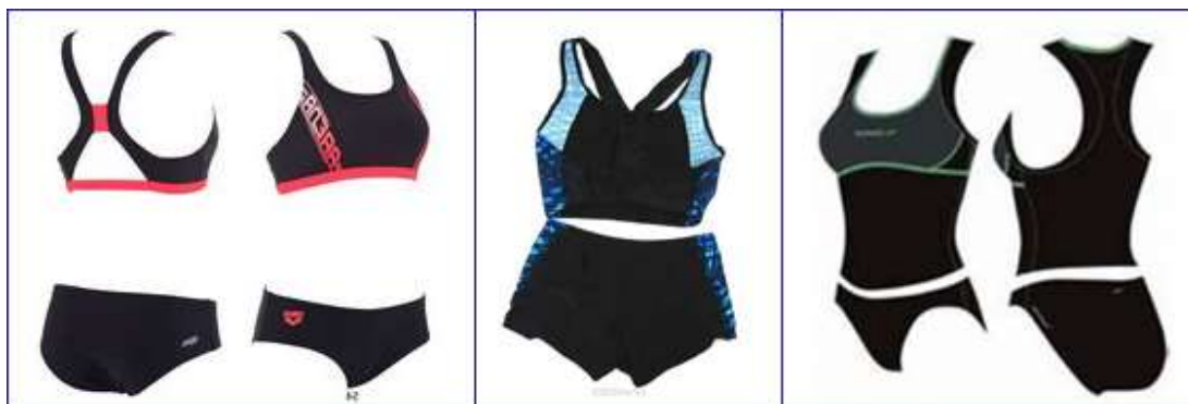
Раздельный спортивный купальник для плавания

Отдельный разговор – женский плавательный костюм для соревнований – это продукт высоких технологий. По правилам соревнований с 2010 года женщины-пловцы могут выступать на соревнованиях в комбинезонах-купальниках по колено. Такой костюм оказывает положительное влияние на скорость, осуществляет компрессию мышц, уменьшает сопротивление воды и позволяет спортсмену принять более высокое положение тела на поверхности воды. Плавательные костюмы для соревнований весьма дороги, и понадобятся только спортсменкам, выступающим на соревнованиях.