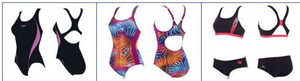
Купальники спортивные для бассейна разных фасонов