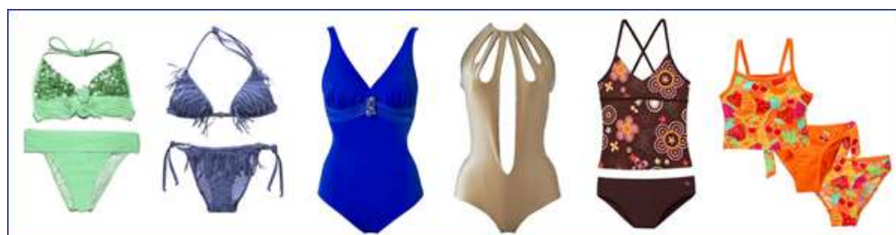
Купальники пляжные: бикини, слитные и танкини

• пляжные купальники. Предназначены для купания в естественных водоемах и отдыха на пляже. Задача такого купальника подчеркнуть красоту и отменный вкус своей обладательницы, замаскировать "нюансы" фигуры. Ткань такого купальника должна быть приятна к телу, устойчива к соленой воде и УФ лучам, не выгорать на солнце. Пляжные купальники производители часто шьют из ярких тканей, украшают различными декоративными элементами: рюшами, металлофурнитурой, бусинами, стразами, завязочками. Девушки с хорошей фигурой чаще всего для пляжа выбирают раздельный купальник бикини, позволяющий загореть большей поверхности тела. Слитный купальник сослужит хорошую службу, если его обладательница предпочитает активный отдых на пляже, например, водные развлечения, пляжный волейбол. Компромиссом между раздельным и слитным купальником служит танкини – раздельный купальник с длинным топом на косточках и трусиками, либо шортиками. Танкини позволяет замаскировать некоторые недостатки фигуры, кроме того, такой купальник хорошо подойдет и для активного отдыха.