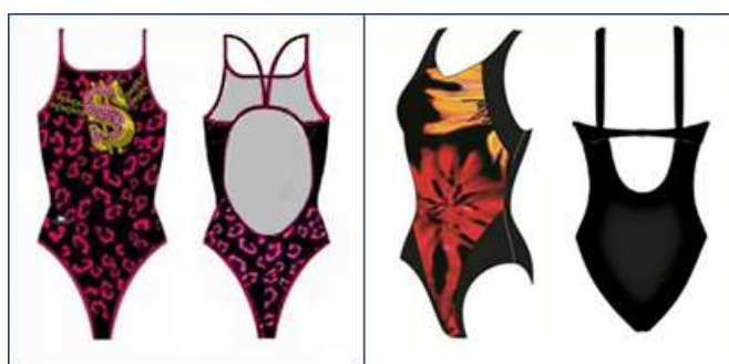
Спортивный купальник для плавания с открытой спиной

Купальник с открытой спиной, как правило, имеет тонкие регулируемые лямки. Такой купальник хорошо подойдет для стройных дам с небольшой грудью. Обладательницам бюсте размера С и больше, при желании купить спортивный купальник на тонких бретелях, нужно искать купальник со вшитой поддержкой груди (она напоминает топ на резинке). Некоторые модели купальников такого типа имеют в дополнении к двум вертикальным бретелькам поперечную бретельку со спины, такой купальник будет лучше держать грудь.