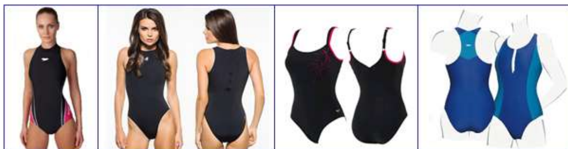
Спортивный купальник для плавания с закрытой спиной

Такой спортивный купальник будет лучшим выбором для полных дам. В таком купальнике обеспечена не только отличная поддержка груди. Эти модели, как правило, обладают и утягивающим эффектом. Так как спортивный купальник этой модели максимально закрывает тело, стоит особенно тщательно подойти к выбору соответствующего размера и роста.