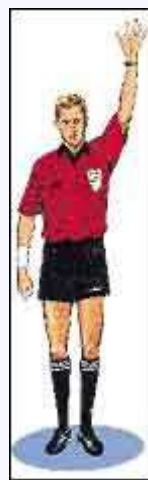
Пятый набранный фол