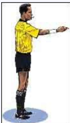
Начало и возобновление игры